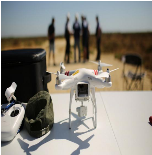
Figura 1: Modelo de dron.

material audiovisual docente en asignaturas de Ingeniería Civil, los resultados obtenidos demostraron que el nuevo método aúna las ventajas de las fuentes tradicionales de adquisición de material audiovisual (versatilidad, calidad, accesibilidad, actualidad, autoría) sin apenas inconvenientes, más allá de la adaptación a su manejo y la actual restricción de vuelo en zonas transitadas y núcleos de población. Este estudio reconocería un salto cualitativo en la documentación gráfica de obras y construcciones civiles, así como en aspectos aplicados de docencia e investigación en este campo de la ingeniería.