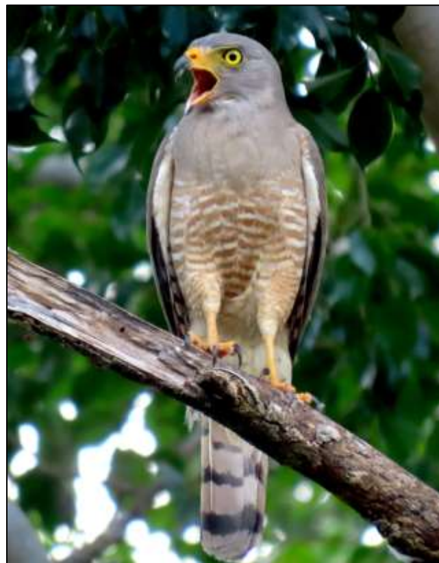
Figura 2. Gavilán Caminero ( Rupornis magnirostris ), ave con dieta especializada considerada vulnerable por la UICN, registrada en los Parques urbanos muestreados.

estructura y disponibilidad de las comunidades de invertebrados, que pueden ser alimento para las aves; ante este escenario, especies con dietas muy especializadas como las rapaces (figura 2) y los colibríes contaron con una representatividad taxonómica relativamente baja; aun así llama la atención que estos grupos aun persisten en estos hábitats. Otras especies con una espectro de dieta más amplia, tuvieron una mayor representatividad taxonómica relativa, muy probablemente debido que las capacidades de adaptarse a estos entornos, en lo referente a la dieta, también promueve una disparidad poblacional con respecto a las poblaciones de especies con dietas especializadas, lo cual influye en la frecuencia de los avistamientos.